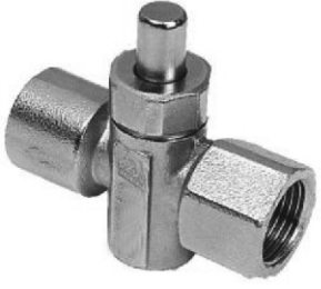
Dişi Dişli Figur 342